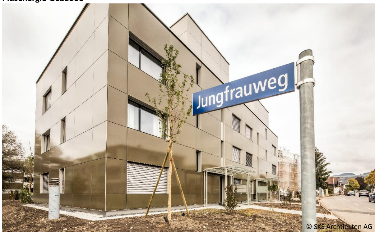
Abb. 2: Die Gebäude der Wohnüberbauung „Sóley“ mit goldbraunen Solarfassaden produzieren mehr Strom als darin verbraucht wird.

Nebst Nachhaltigkeit und Regionalität geht die Pensionskasse BKW mit der Wohnüberbauung „Sóley Münsingen“ noch einen Schritt weiter: Dort werden zwei bestehende Gebäude totalsaniert und mit einem Neubau ergänzt. Die Fassadenteile wurden goldbraun eingefärbt, damit sie sich farblich ins bestehende Quartier einfügen. Dank Solaranlagen auf Dach und an allen Fassaden wird mehr Energie produziert, als in den 40 Wohnungen verbraucht wird. Sprich: Die Solaranlagen produzieren mehr Strom als für Licht, Heizung, Haushaltsgeräte und für die Elektrofahrzeuge der Bewohner benötigt wird. Für letztere werden in der Einstellhalle bereits Parkplätze mit Ladestationen eingerichtet. Überschüssiger Strom wird ins öffentliche Netz eingespeisen.