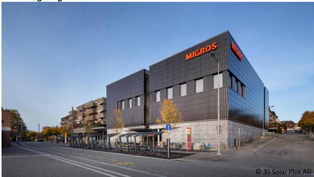
Abb. 1: Neues Migros Münsingen mit blau-schwarzer Solarfassade