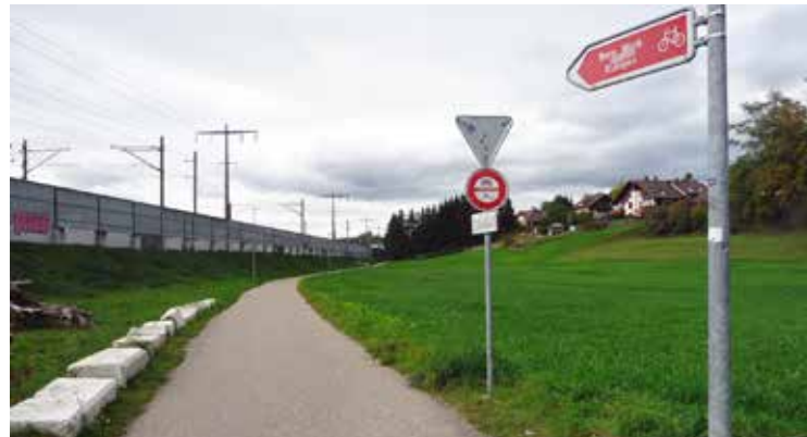
Knacknuss Bahnunterführung und Kreuzung Radweg

Trotz der grossen Eile – das Ja oder Nein zur Entlastungsstrasse ist noch längst nicht gefallen. 2016 oder 2017 wird die Bevölkerung im Rahmen der öffentlichen Mitwirkung zum Projekt Stellung nehmen können. Der Baukredit benötigt einen Parlaments- und möglicherweise auch einen Volksentscheid.