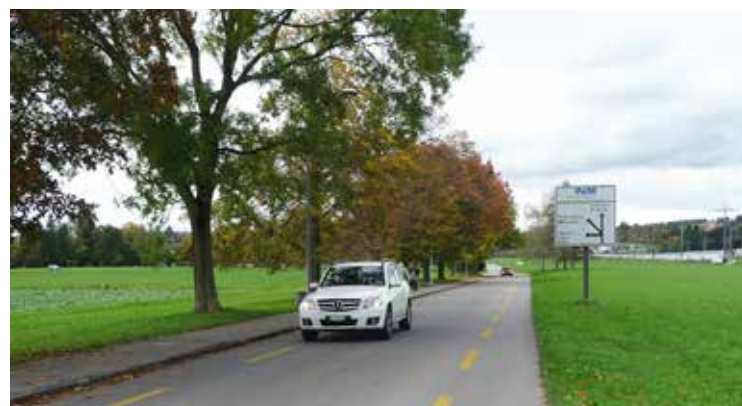
Gesucht: Verträgliche Linienführung und Ausgestaltung