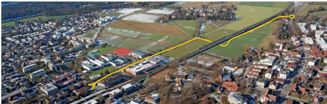
Linienführung im Vorprojekt