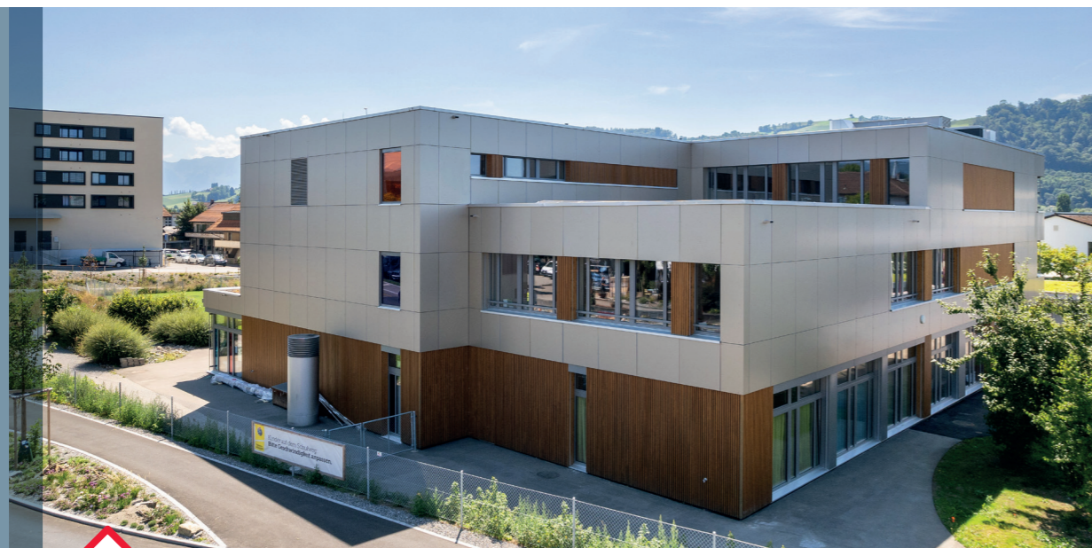
Erweiterungsbau Prisma Schulanlage Schlossmatt