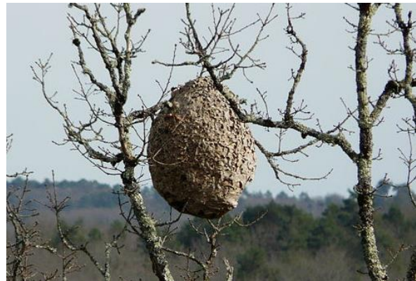
Abbildung 2: Hauptnest in Baumkrone

Bitte melden Sie verdächtige Vor- und Hauptnester und Insekten (mit Bild und Koordinaten) an die Meldestelle für verdächtige Insekten und Nester: