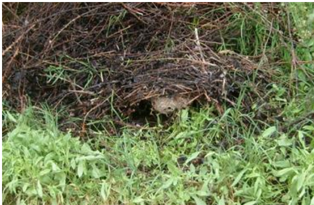
Abbildung 1: Vornest im Frühling http://www.hornissenschutz.ch/vespa-velutina-nth.htm

Daher bitten die Behörden der Region Nordwestschweiz von April bis Anfangs Juli vor allem um Beobachtungen von Hecken, Unterständen, Vordächern und ähnlichen geschützten Stellen. Dort könnte sich ein Vornest befinden. Beispiele finden Sie weiter unten (Abbildungen 1 und 3).