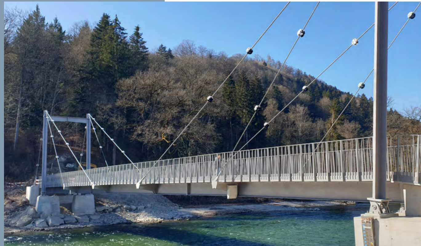
Der Ersatzneubau Schützenfahrbrücke wurde am 10. Mai 2025 offiziell eröffnet.