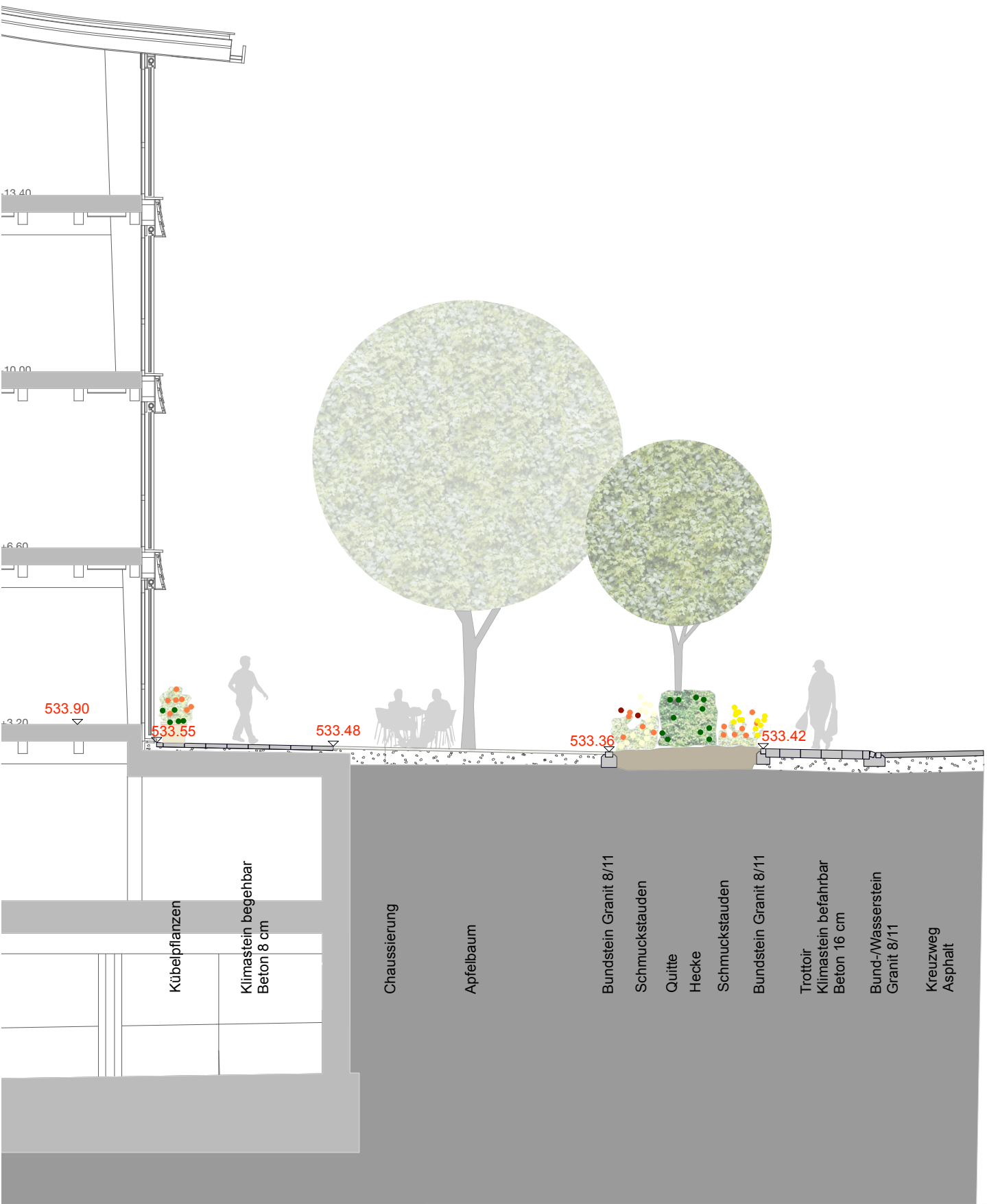
Schnitt B-B' Ost, Bauerngarten

Gemeinde Münsingen Abteilung Bau Bereich Liegenschaften Thunstrasse 1 3110 Münsingen