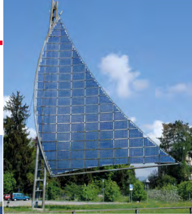
Abb. 1: Titelbild des öffentlichen Informationsanlasses vom 1. April 2025.

Um die Energiewende zu schaffen und bis im Jahr 2050 die Treibhausgasemissionen auf Netto-Null zu senken, müssen die Sanierungsrate im Schweizer Gebäudepark gesteigert und der Ausbau erneuerbarer Energien entschieden vorangetrieben werden. Für den Einzelnen bedeuten beide Punkte jedoch meist hohe Investitionen – das will gut überlegt sein. Die Gemeinde Münsingen bietet Unterstützung.