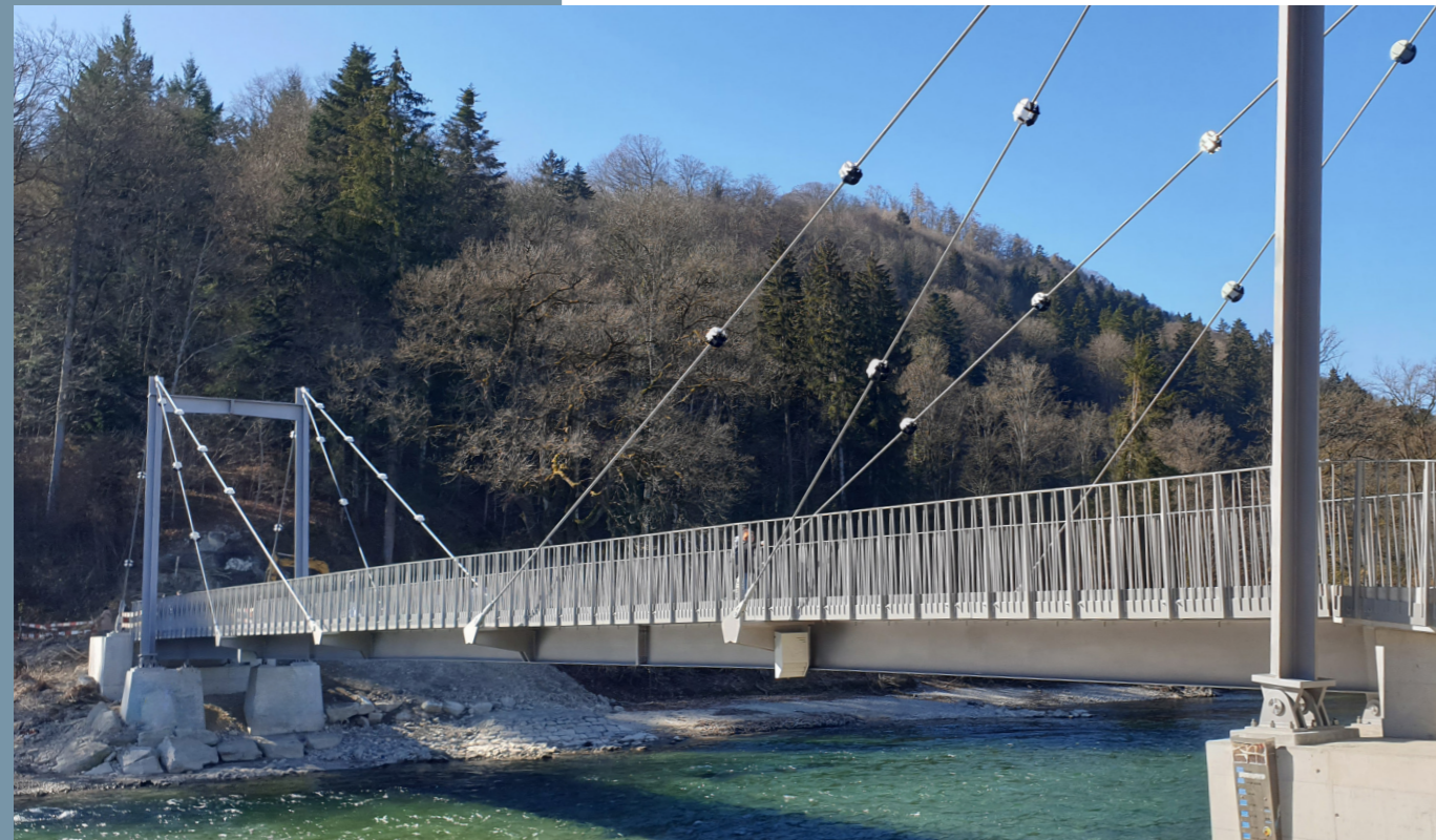
Der Ersatzneubau Schützenfahrbrücke wurde am 10. Mai 2025 offiziell eröffnet.