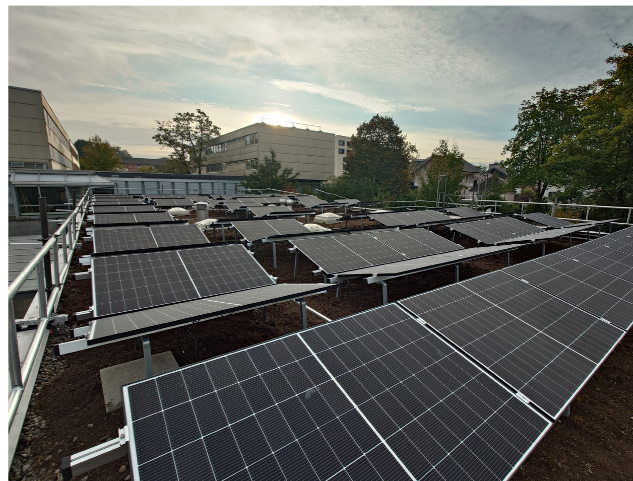
Die Solaranlage Kindergarten Schlossmatt ist seit Herbst 2025 in Betrieb.